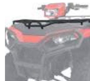
2884842 Rack Dianteiro HD NOVO SPORTSMAN 570