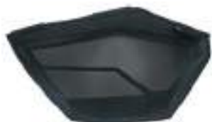
2884304 Bolsa de Porta RZR PRO XP