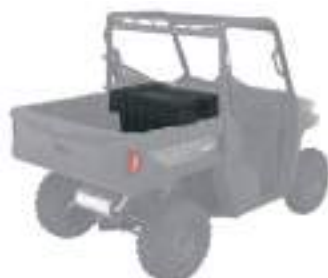
2889199 Porta Objetos NOVO RANGER