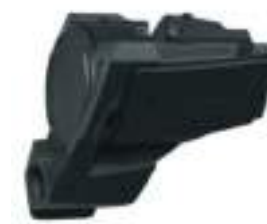
2884914 Stage 3 de Som RZR TRAIL S