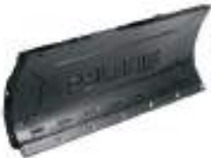
2879639 Pá niveladora SPORTSMAN 570