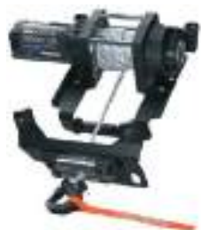
2885126 Guincho 4500lb Pro HD RZR TRAIL S