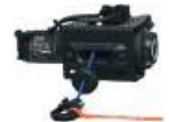
2884833 Guincho 3500lb NOVO SPORTSMAN 570