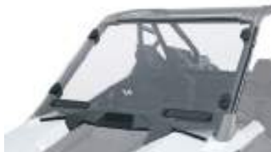
2883756 Para-Brisa com abertura RZR PRO XP