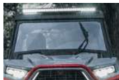
2884755 Limpador de para-brisa (Somente vidro) RZR TRAIL S