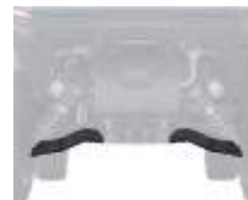
2884222 Proteção Bandeja Traseira GENERAL