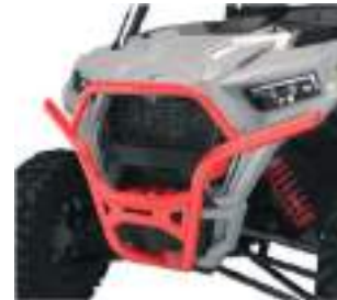
2884019-458 Low Profile Bumper RZR TRAIL S