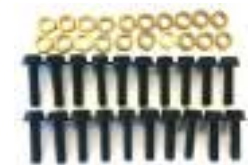
2205496 Parafuso Bead Lock Racing 14" GENERAL / RZR PRO XP