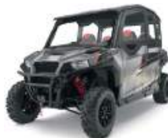
2883453 Complemento Porta Canvas GENERAL