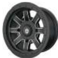
1522238-458 Roda Pro Armor Racing 14" GENERAL / RZR PRO XP