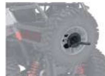
2884762 Porta Estepe RZR TRAIL S