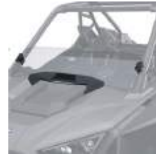
2884966 Meio Para-Brisa RZR TURBO R / RZR PRO R