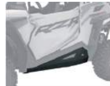
2879498-458 Low Profile Rock Sliders RZR TRAIL S