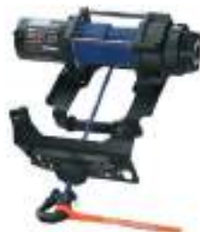
2885127 Guincho 3500lb HD RZR TRAIL S