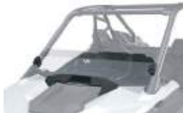
2883754 Meio Para-Brisa RZR PRO XP