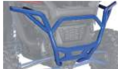
2883748-751 Para-Choque Traseiro Sport Azul RZR PRO XP