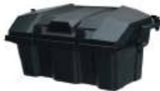
2884235 Porta Objetos 60lt RZR PRO R