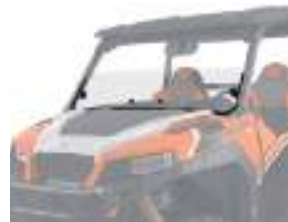
2881111 Meio Para-Brisa Poly GENERAL