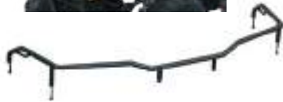
2879716 Extensor Rack Dianteiro SPORTSMAN 570