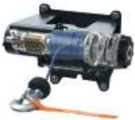
2884340 Guincho 4500lb RZR TURBO R / RZR PRO R