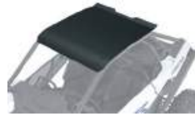
2883743-458 RZR PRO XP 2884237-458 RZR TURBO R Teto de Alumínio