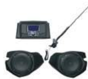
2884912 Stage 1 de Som RZR TRAIL S