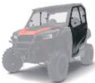
2883717 Porta Poly GENERAL