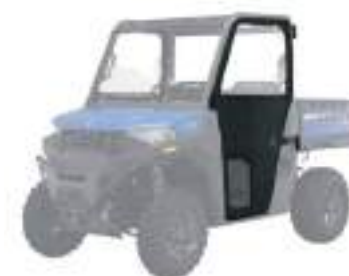
2885075 Porta Canvas NOVO RANGER