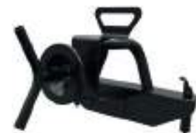
2881529 Rhino-Rack Porta-Estepe GENERAL