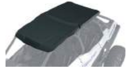
2883946 Teto Poly 4 Lugares RZR PRO XP / RZR TURBO R