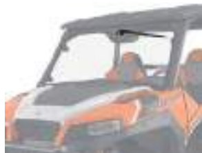
2881090 Limpador Para-Brisa GENERAL