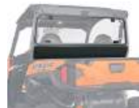
2881113 Fechamento Traseiro Vidro GENERAL