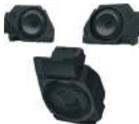
2884255 RZR PRO XP 2884655 RZR TURBO R Sistema de Som Rockford Fosgate