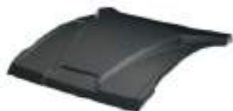
2884729 Teto Sport Poly RZR TRAIL S