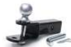
2830522 Engate completo NOVO RANGER