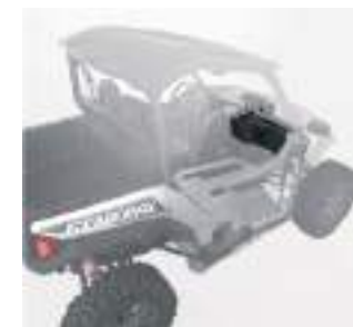
2889306 Som Stage 3 GENERAL