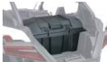
2883751 Porta Objetos 73L RZR PRO XP / RZR TURBO R