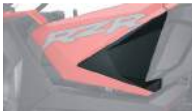
2883765 Fechamento de Porta RZR PRO XP