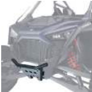
2884354-458 Para-Choque Dianteiro Racing RZR TURBO R / RZR PRO R