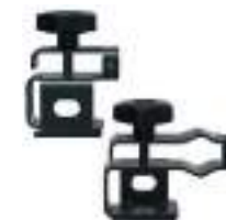
2889533 Rhino-Rack Kit Elevação GENERAL