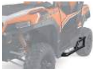
2881101 Proteção Lateral 2 Lugares GENERAL