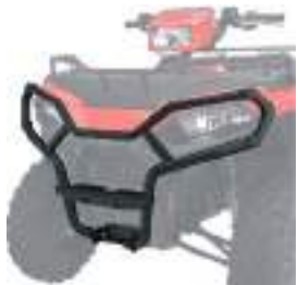
2884844 Para-Choque Dianteiro NOVO SPORTSMAN 570