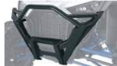
2883749-458 Para-Choque Dianteiro Expedition RZR PRO XP