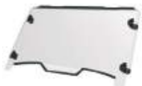
2884757 Para-brisa Inteiro RZR TRAIL S