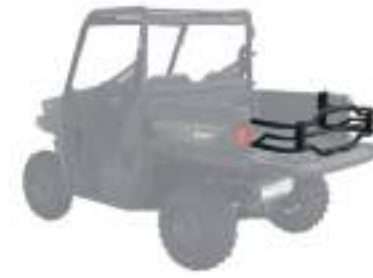
2889183 Extensor de caçamba NOVO RANGER