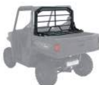
2889182 Rack de carga NOVO RANGER