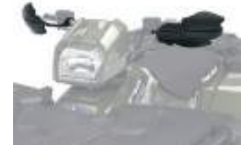
2876846 Protetor de mão Para instalação é necessário também o 2879380 SPORTSMAN 570 E NOVO SPORTSMAN 570