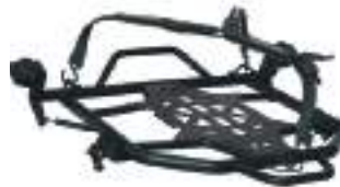
2884326-458 Porta Estepe RZR PRO R