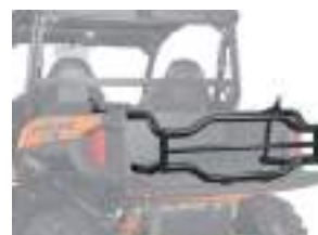
2881547 Rhino-Rack Extensor de Caçamba GENERAL