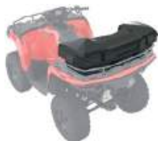
2884857 Porta Objetos Traseiro NOVO SPORTSMAN 570