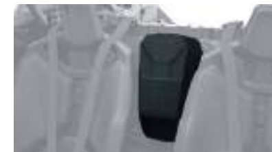
2884286 Bolsa de Ombro RZR PRO XP