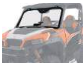
2881108 Para-Brisa Dianteiro Vidro GENERAL