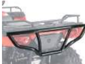
2879715 Para-Choque Dianteiro SPORTSMAN 570