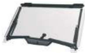
2884773 Para-brisa Inteiro Basculante RZR TRAIL S