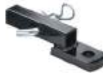
2877476 Engate SPORTSMAN 570