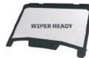
2884756 Para-brisa inteiro de vidro RZR TRAIL S