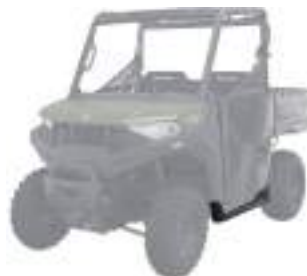
2889180 Proteção Lateral NOVO RANGER