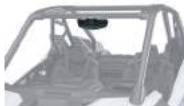
2883763 Retrovisor Interno RZR PRO XP / RZR TURBO R / RXR PRO R