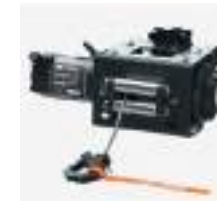
2884832 Guincho 2500lb NOVO SPORTSMAN 570