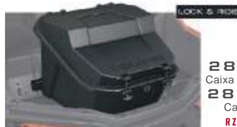
2881193 Caixa Porta-Objetos 2881556 Caixa Cooler RZR TRAIL S