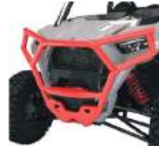
2884732-458 High Coverage Bumper RZR TRAIL S