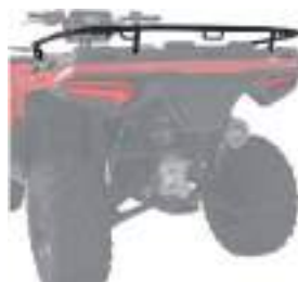
2884841 Rack Traseiro NOVO SPORTSMAN 570