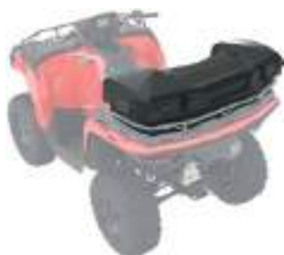
2884853 Cooler Traseiro NOVO SPORTSMAN 570