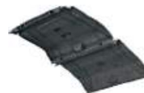
2883802 Forro Teto GENERAL