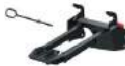
2881424 Link para Pá SPORTSMAN 570