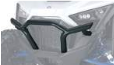
2883746-458 Para-Choque Dianteiro Sport RZR PRO XP