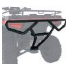
2884847 Para-Choque Traseiro NOVO SPORTSMAN 570