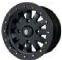
1523266 Roda Pro Armor Racing 15" GENERAL / RZR PRO XP