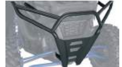
2884189-458 Para-Choque Traseiro Expedition RZR PRO XP