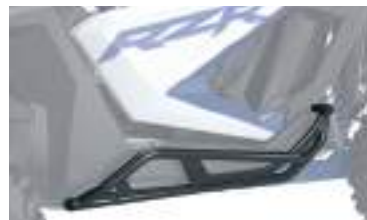
2883997-458 RZR PRO XP 2889208-458 RZR TURBO R / RZRPRO R Protetor Lateral