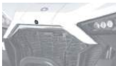
2884432 Câmera Dianteira RZR PRO XP