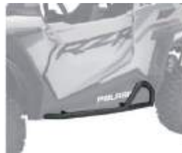
2879456-458 Kick-Out Rock Sliders RZR TRAIL S