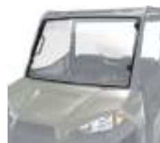
2883318 / 2883319 Para-Brisa Inteiro NOVO RANGER