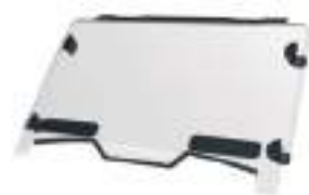
2884911 Para-brisa Inteiro com ventilação RZR TRAIL S