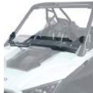
2884746 Meio Para-Brisa Baixo RZR TURBO R / RZR PRO R