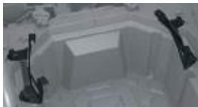
2884070 Suporte de Cooler RZR PRO XP