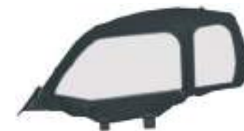
2884733 Fechamento Lateral RZR TRAIL S