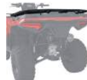
2884843 Rack Traseiro HD NOVO SPORTSMAN 570