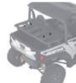
2889527 Rhino-Rack Kit Anílla GENERAL