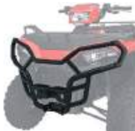
2884850 Para-Choque HD NOVO SPORTSMAN 570