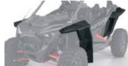
2884685 Extensor de Paralamas RZR PRO XP / RZR TURBO R / RZR PRO R