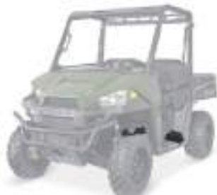
2880551 Proteção Bandeja Traseira NOVO RANGER