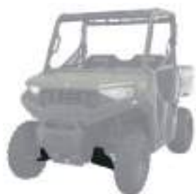
2885097 Proteção Bandeja Dianteira NOVO RANGER