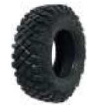
5416397 Pneu Pro Armor XG RODAS ARO 15"