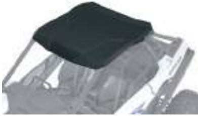
2883928 Teto Poly RZR PRO XP / RZR TURBO R