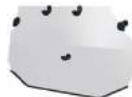
2884765 Fechamento traseiro RZR TRAIL S