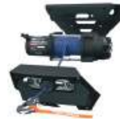
2883758 Guincho 4500lb RZR PRO XP