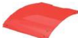
2884761-458 Teto Sport Alumínio RZR TRAIL S