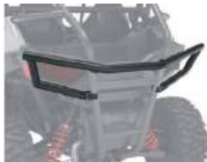
2884734-458 Rear Bumper Extensions RZR TRAIL S