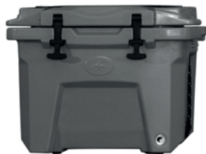
2883424 Cooler RZR PRO XP