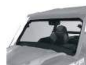
2889156 Para-Brisa Dianteiro Poly GENERAL