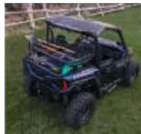
2889443 Rhino-Rack GENERAL