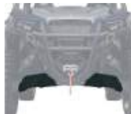
2884221 Proteção Bandeja Dianteira GENERAL