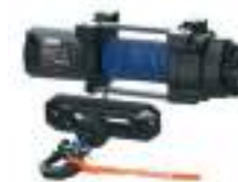
2885095 Guincho 3500lb 2885096 Guincho 4500lb NOVO RANGER