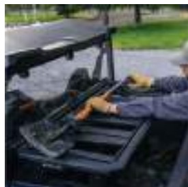
2889528 Rhino-Rack Kit Multi-Funcional GENERAL