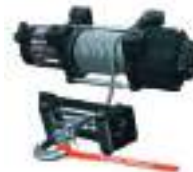
2880432 Guincho 2500lb SPORTSMAN 570