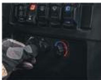
2884735 Climatizador RZR TRAIL S