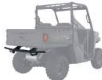
2885087 Para-Choque Traseiro NOVO RANGER