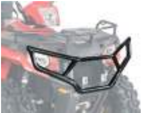
2879714 Para-Choque Dianteiro SPORTSMAN 570