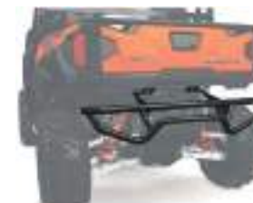
2884345 Para-Choque Traseiro GENERAL