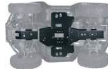
2884852 Skid Plate NOVO SPORTSMAN 570