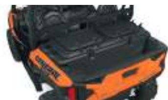
2881527 Rhino-Rack Bagageiro GENERAL