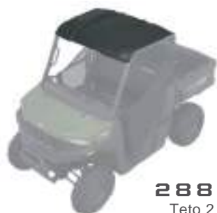
2885077 Teto 2 Lugares NOVO RANGER