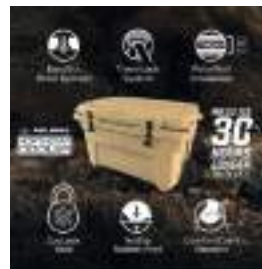
2883426 Rhino-Rack Cooler 106L GENERAL