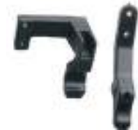
2879380 SPORTSMAN 570 E NOVO SPORTSMAN 570