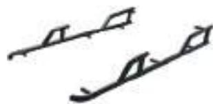
2881992 Proteção Lateral 4 Lugares GENERAL