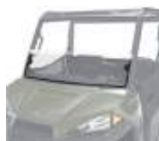
2883320 Meio Para-Brisas NOVO RANGER