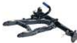
2879630 Suporte de Pá SPORTSMAN 570