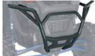
2883748-458 Para-Choque Traseiro Sport RZR PRO XP