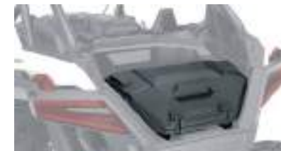
2883752 RZR PRO XP 2884236 RZR TURBO R / RZR PRO R Porta Objetos 36L