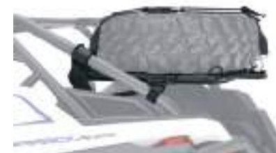
2883745-458 Suporte de Estepe RZR PRO XP