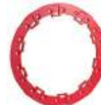
1522244-293 Aro Bead Lock Racing 14" GENERAL / RZR PRO XP