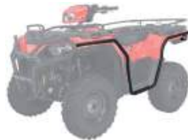
2884851 Protetor Lateral Completo NOVO SPORTSMAN 570