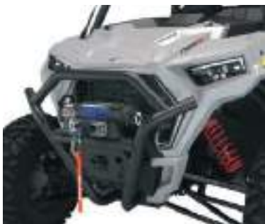
2884868-458 Winch Bumper RZR TRAIL S