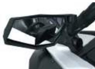
2883762 Retrovisores Laterais RZR PRO XP / RZR TURBO R / RXR PRO R