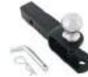
2830522 Engate com bola NOVO SPORTSMAN 570