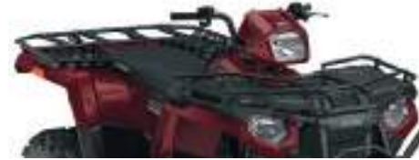
2882321 Extensor Rack Dianteiro 2882322 Extensor Rack Traseiro AMBOS P/ SPORTSMAN 570