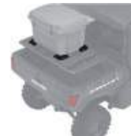
2889531 Kit Cooler Mount GENERAL