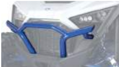
2883746-751 Para-Choque Dianteiro Sport Azul RZR PRO XP