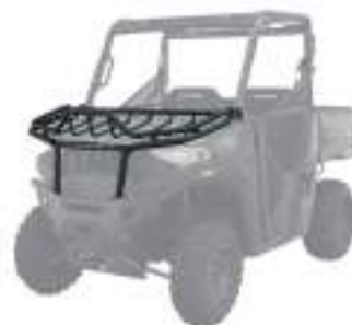
2885088 Rack Dianteiro NOVO RANGER