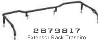
2879817 Extensor Rack Traseiro SPORTSMAN 570