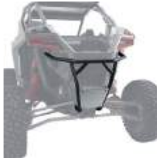
2884585-458 Para-Choque Traseiro Racing RZR TURBO R