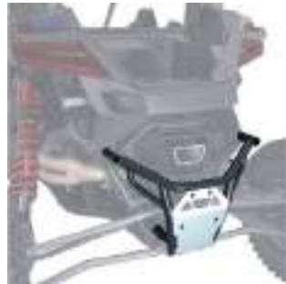
2884358-458 Para-Choque Traseiro Racing RZR PRO R